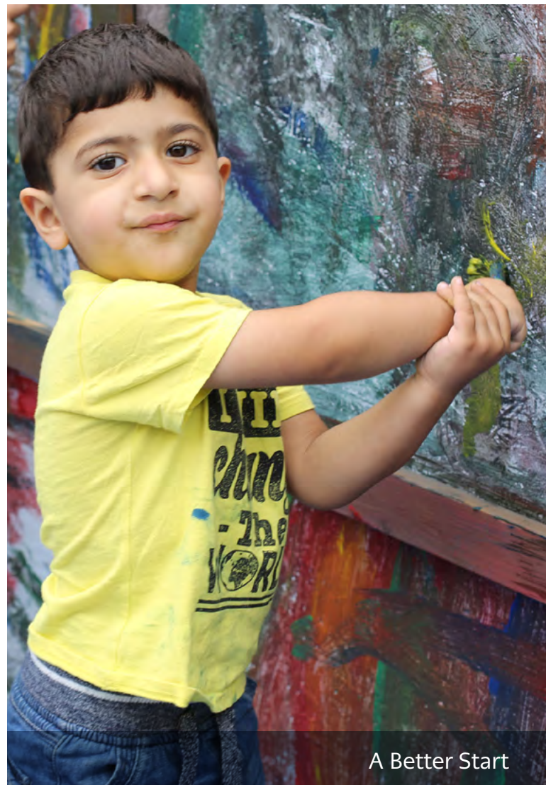
A Better Start

Esboniodd rhiant-hyrwyddwr o Bartneriaeth Gweithredu Cynnar Lambeth (A Better Start)