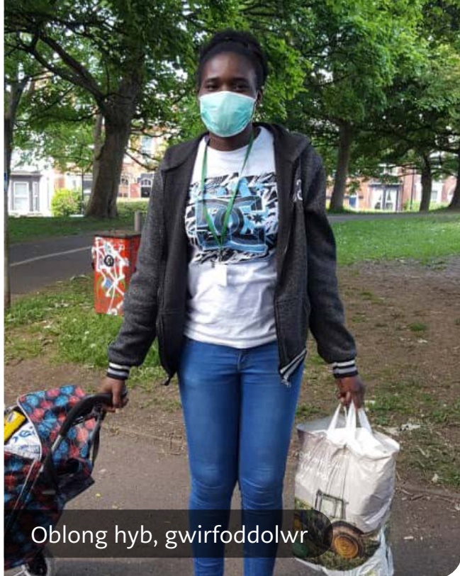
Oblong hyb, gwirfoddolwr

Heb wybodaeth lawr gwlad, roedd perygl na fyddai gwasanaethau'n cydweddu: mae'n nodi "parseli bwyd heb unrhyw ystyriaeth o alergeddau, dim cynnig diwylliannol. Mae hon yn wers bwysig iawn imi: peidiwch â cheisio gwneud pethau lleol o lefel genedlaethol."