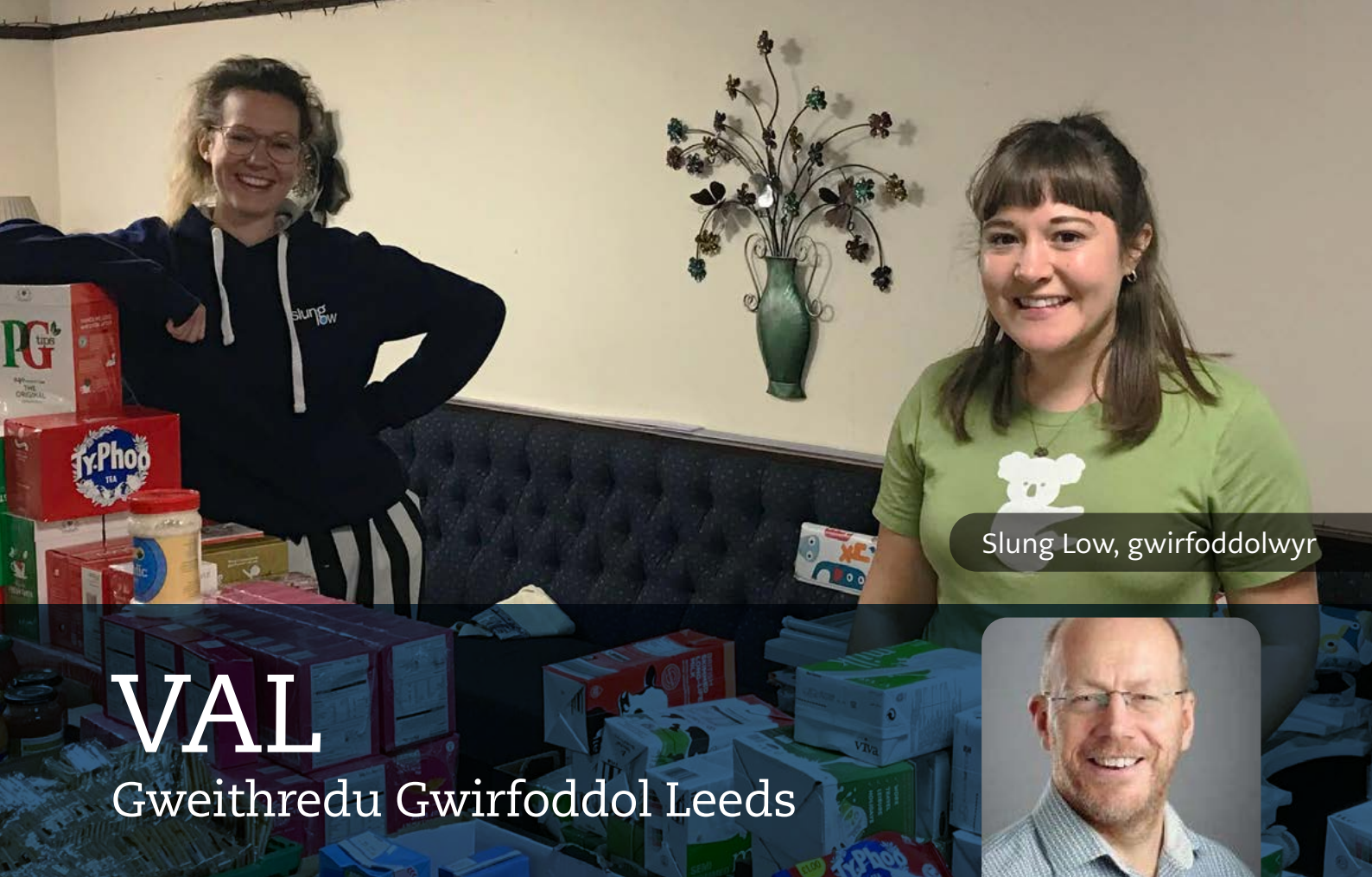
Slung Low, gwirfoddolwyr