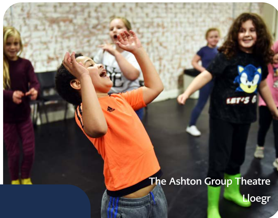
The Ashton Group Theatre Lloegr

Fel yr ariannwr mwyaf ar gyfer gweithgarwch cymunedol yn y DU, gwyddom fod cysylltiadau cymdeithasol a phrosiectau cymunedol wrth wraidd creu bywydau iachach, hapusach a chymdeithas lewyrchus.