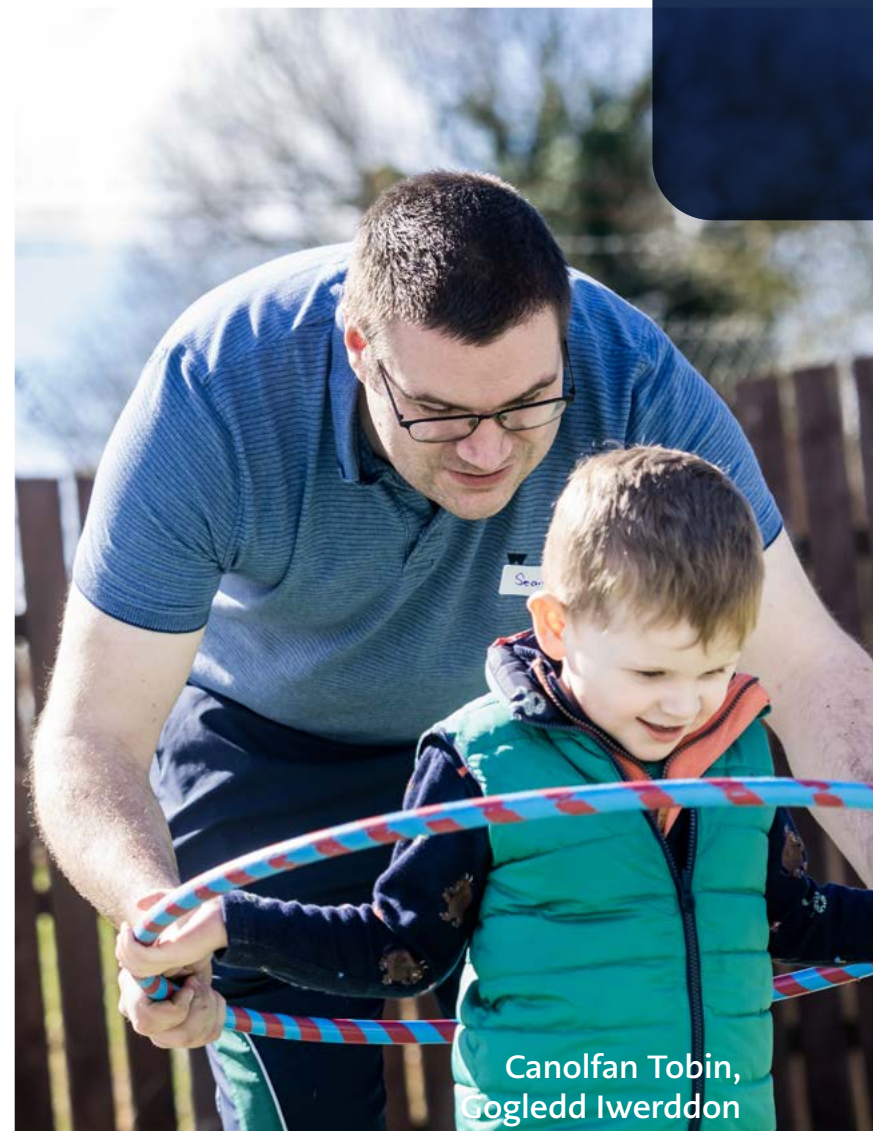
Canolfan Tobin, Gogledd Iwerddon

Gallwch lywio drwy'r gwahanol adrannau gan ddefnyddio'r dolenni yn y tabl cynnwys a'r botymau ar waelod pob tudalen.