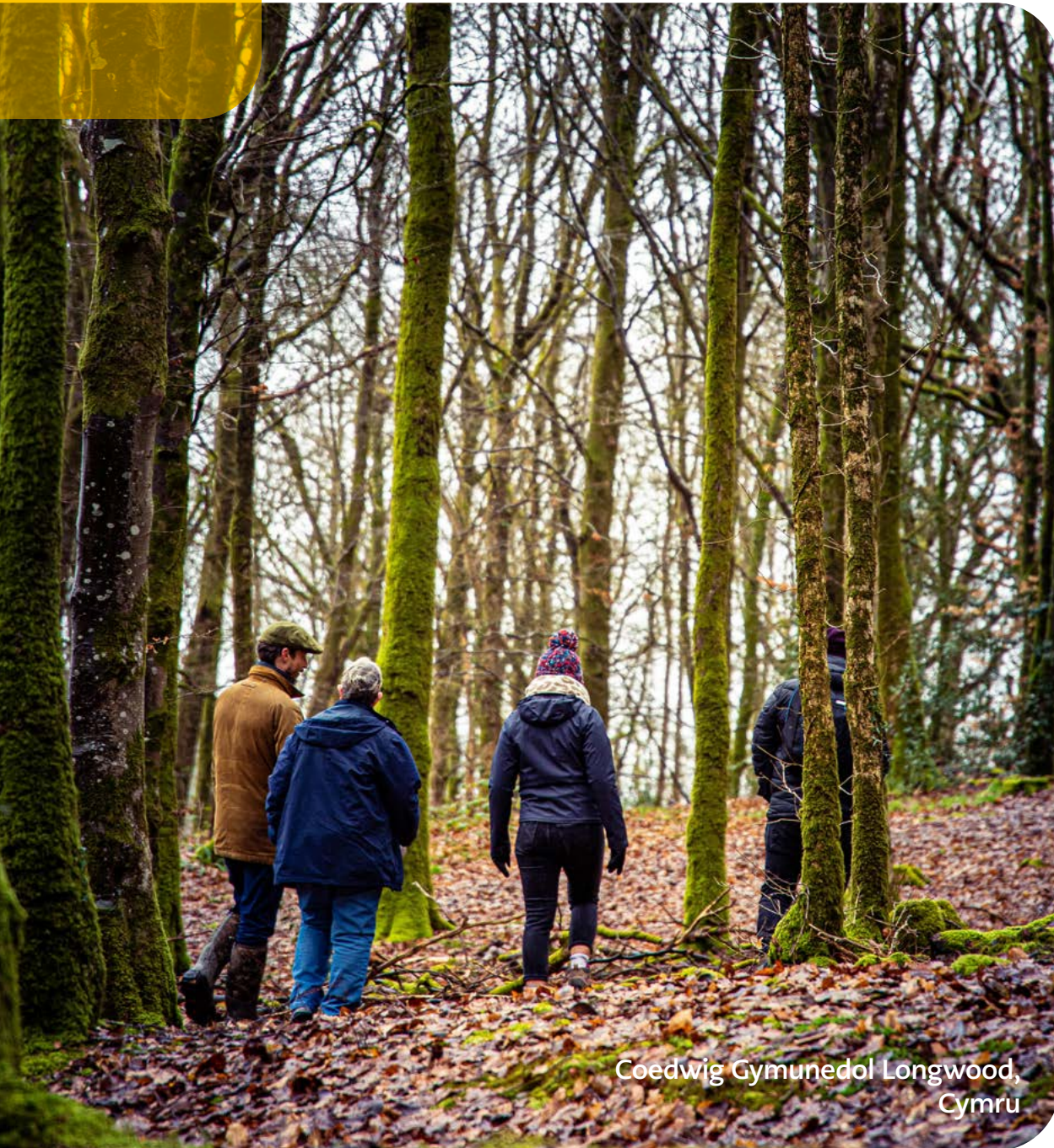
Coedwig Gymunedol Longwood, Cymru