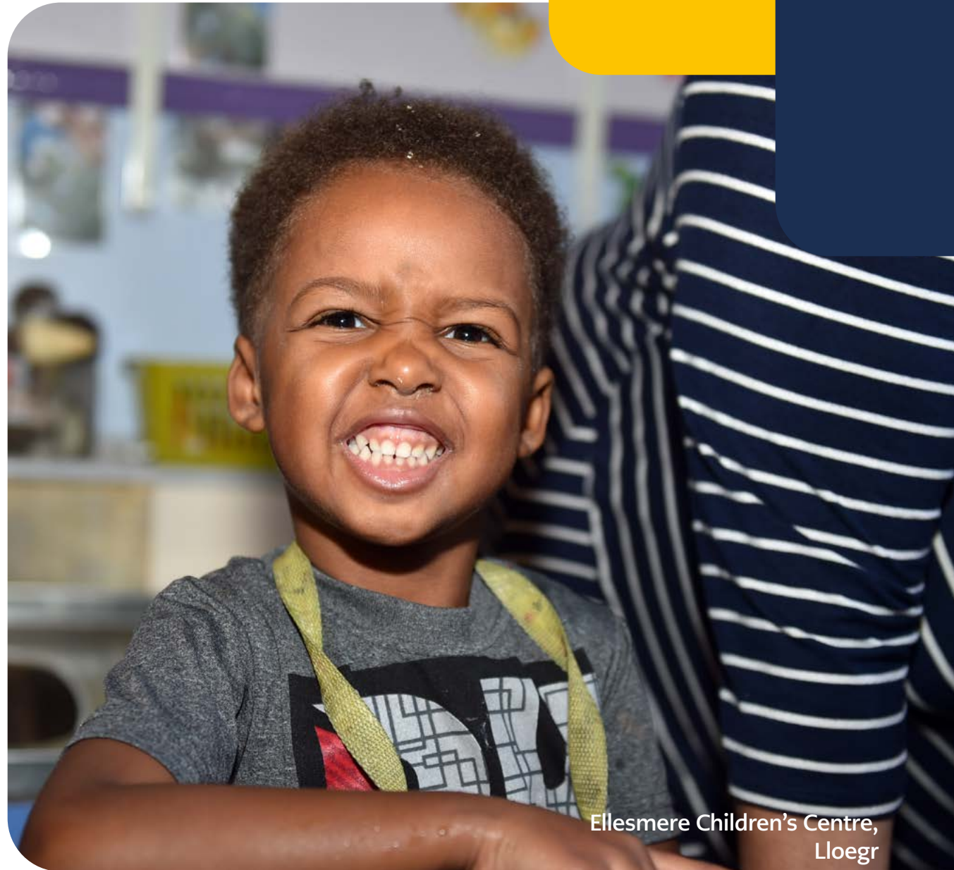
Ellesmere Children's Centre, Lloegr