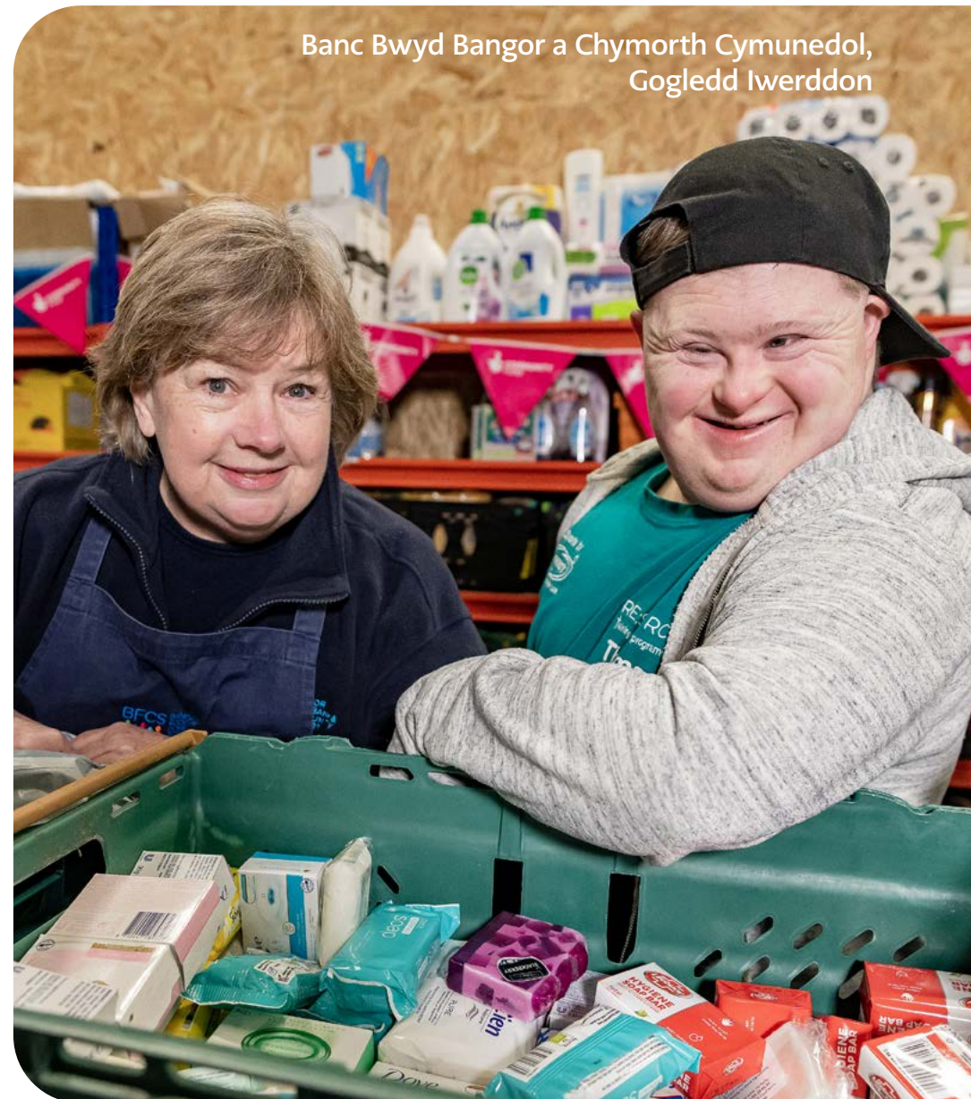
Banc Bwyd Bangor a Chymorth Cymunedol, Gogledd Iwerddon

Yn ganolog i'r strategaeth oedd ein haddewid i gyflwyno newidiadau i Arian i Bawb y Loteri Genedlaethol a'n huchelgais i gefnogi prosiectau cymunedol ar lawr gwlad ymhellach ledled y DU. Ym mis Tachwedd 2023, bydd y newid mwyaf i Arian i Bawb y Loteri Genedlaethol am genhedlaeth yn cael ei roi ar waith.