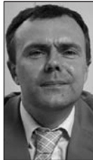
Paul Cavanagh Aelod Gogledd Iwerddon Cadeirydd, Pwyllgor Cronfa Pobl Ifanc Gogledd Iwerddon