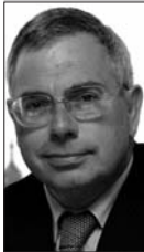
Huw Vaughan Thomas Aelod Cymru Cadeirydd, Pwyllgor Rhaglen Ariannu Gwirfoddol a Chymunedol Cymru Cadeirydd, Pwyllgor Cronfa Pobl Ifanc Cymru Cadeirydd, Panel Gwerthuso a Dysgu (o fis Mawrth 2006)